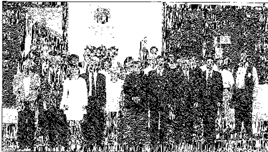
A szigetvári Rákóczi szervezet által kezdeményezett Rákóczi emléktábla

A Rákóczi Szövetség összes taglétszáma elérte az 5026 főt, a 2004-ben belépett új tagok száma 804.