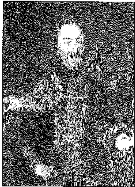
Gróf Ráday Pál, az első magyar főszerkesztő

nyí vereség indokolta, amely után újra égető fontosságúvá vált a külföld tájékoztatása. Ez volt az utolsó Ráday Pál által szerkesztett szám.