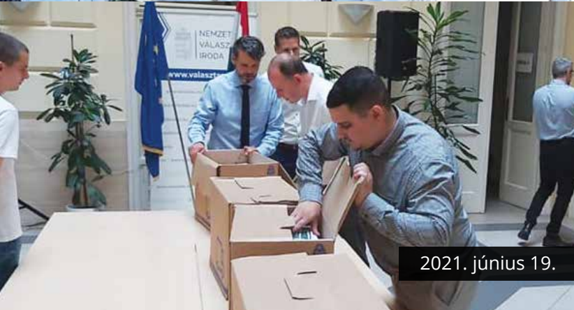
2021. június 19.