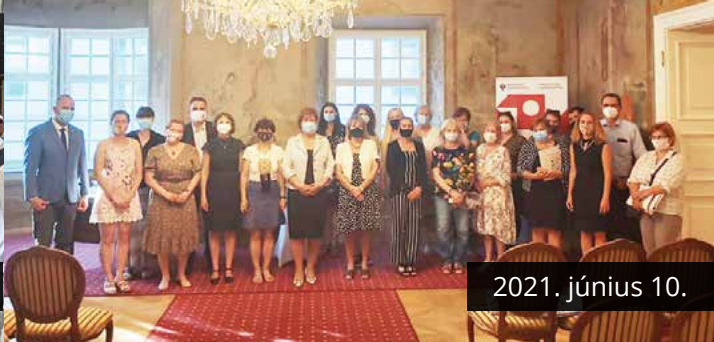
2021. június 10.