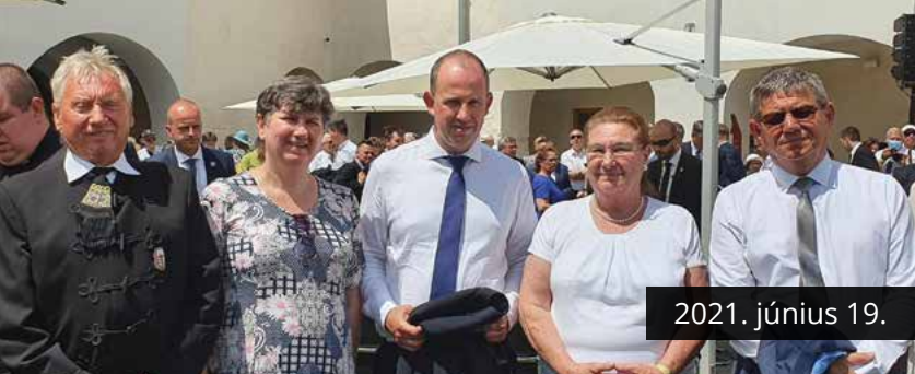
2021. június 19.