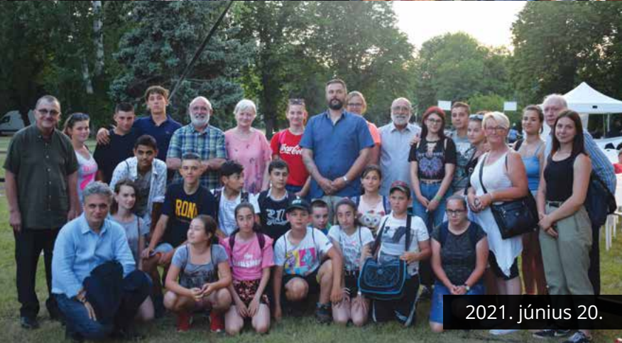
2021. június 20.