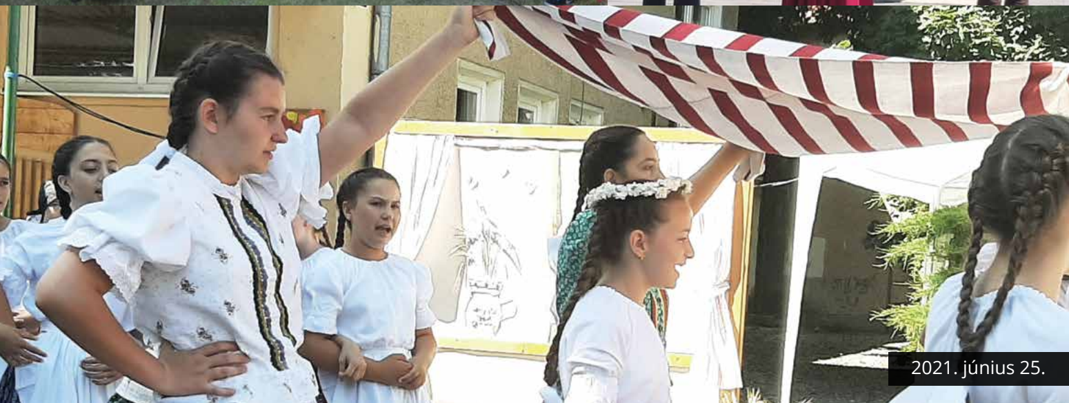
2021. június 25.