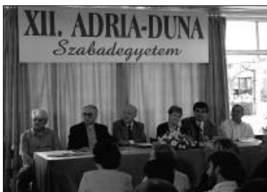
XII. Adria-Duna Szabadegyetem