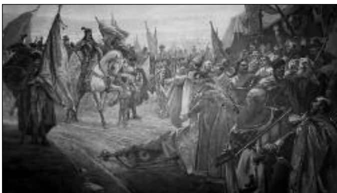
II. Rákóczi Ferenc Magyarország területére lép