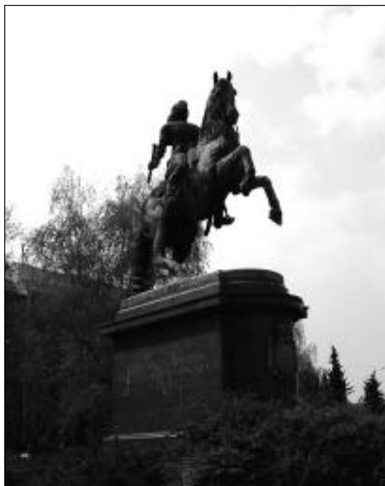
II. Rákóczi Ferenc szobra a Kossuth téren