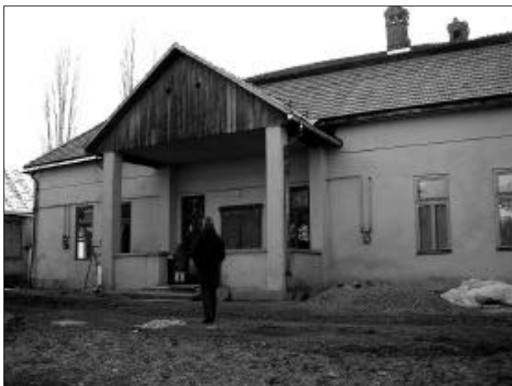
A nagybányai Teleki Ház