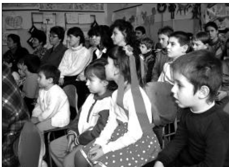
A pozbai alapiskola kisdíákjai

A beiratkozási program sikerében nagy része van a minden családra kiterjedő felvilágosító munkának és a magyar iskolába történő beiratkozást népszerűsítő közösségi programoknak, továbbá a meghirdetett diáktámogatásoknak (tanszercsomag, étkezési- és bejárás támogatás). Emellett az iskola-választásra vonatkozó döntést befolyásolhatta a Célalapoknak a kedvezménytörvénnyel összefüggő oktatás-nevelési támogatást népszerűsítő tevékenysége is. Ennek eredményeként 2002. év végéig 425 pályázatot nyújtottak be az Illyés Közalapítványhoz.