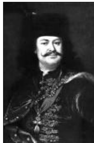
II. Rákóczi Ferenc

Az év folyamán a Rákóczi Szövetség Elnöksége 6 alkalommal, Választmánya pedig 2 alkalommal, az Ellenőrző Bizottság 1 alkalommal ülésezett.