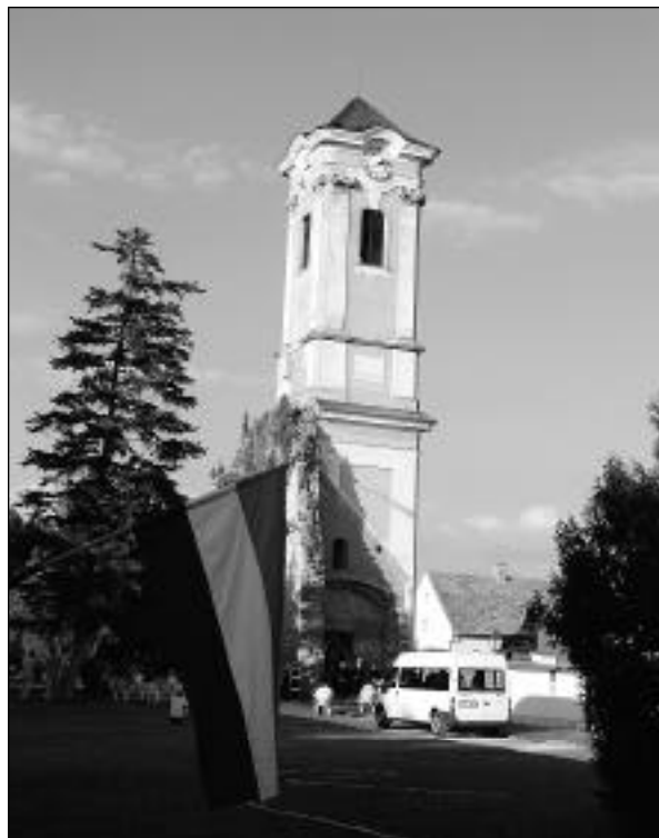
A majki Kamalduli emlékegyüttes

November 18-án a Rákóczi Szövetségnek az Evangélikus Hittudományi Egyetemen működő alapszervezete, a Thököly Evangélikus Kör történelmi vetélkedőt szervezett református, evangélikus és baptista teológushallgatók részére. A rendezvényen több, határainkon túl élő Magyarországon ösztöndíjjal tanuló diák is részt vett. A vetélkedő témája a Rákóczi szabadságharc, az 1848-49-es szabadságharc, valamint Trianon volt.