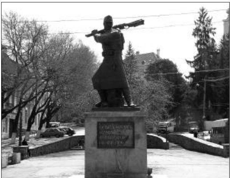
A „Vas-székely” szobor Székelyudvarhelyen