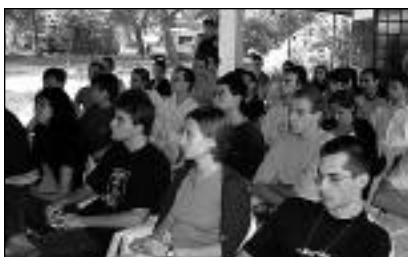
A főiskolás tábor résztvevői

Római Part, Budapest, 2002. augusztus 26-szeptember 1.