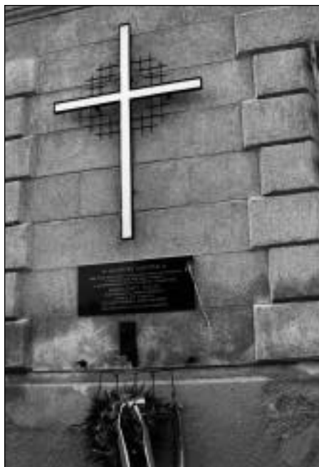
A márianosztrai kegyhely

(2002. július 15 - július 20, Pannonhalma)