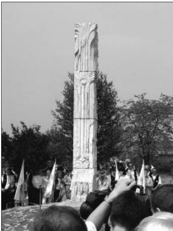
Az Ároni országgyűlés emlékoszlopa

Május 21-én a Rákóczi Szövetség tatabányai szervezete a Tartalékos Katonák Országos Egyesületével közösen Párkányban, az Ady Endre magyar tanítási nyelvű alapiskolában rendezte meg „Törökvilág Magyarországon” című történelmi és ügyességi vetélkedőjét.