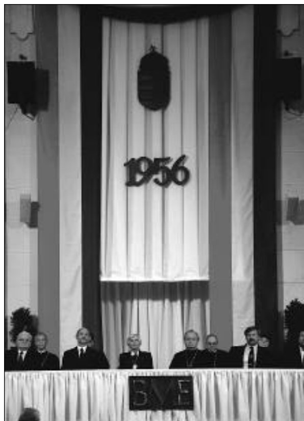
Október 22-i megemlékezés a Műegyetemen