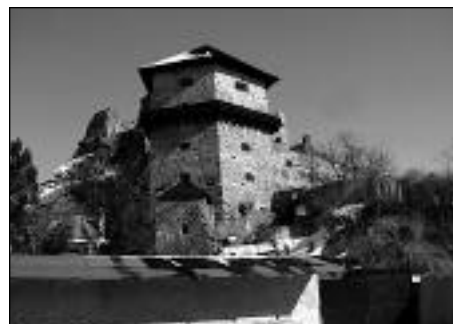
A füleki vár