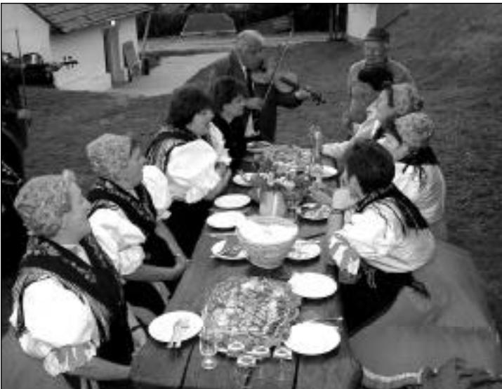
Nagyrédei szüreti bál

Szeptember 13-16 között a Rákóczi Szövetség felsőszevén szervezeteinek küldöttsége Fekete András vezetésével Naszvadon részt vett a „Naszvadiak Találkozója” című rendezvényen.